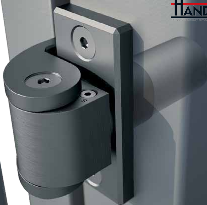
Przykręcany wspornik mocujący